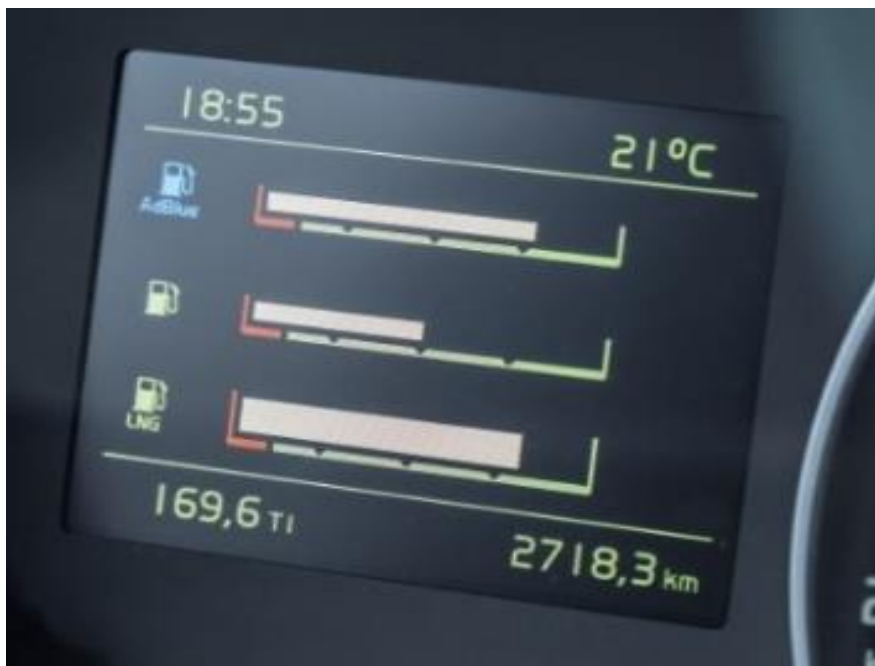
Füllstandanzeige LNG